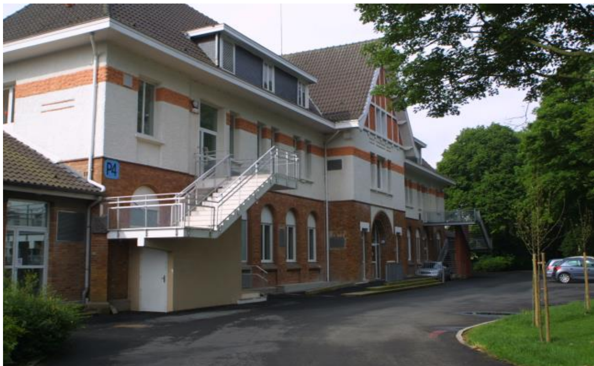
L'Unité P4 située dans l'enceinte de l'EPSM des Flandres