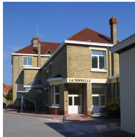
Centre de soins La Tonnelle